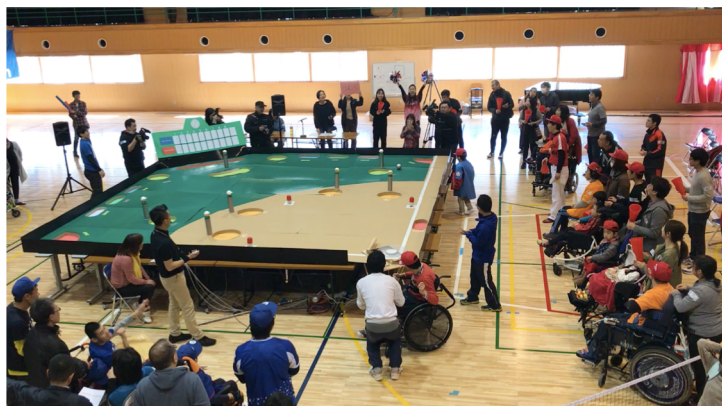
2019年5月24日開催の体験会の様子(スタジアムは2号機)